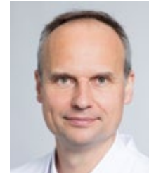
Prof. Dr. Paulus Kirchhof